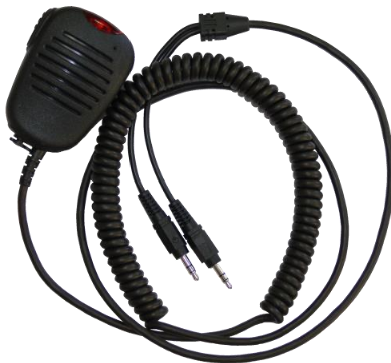
Рисунок 1 - Общий вид гарнитуры ADM1

Гарнитура работает как пассивное устройство и выполняет роль только микрофона, динамика громкой связи и кнопки.